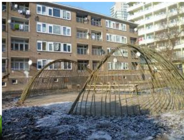
De vlechterij, www.vlechterij.nl