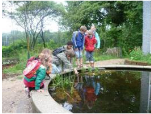
oude zandbak hergebruiken