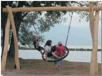
Acacia Robinia nl www.acacia-robinia.nl