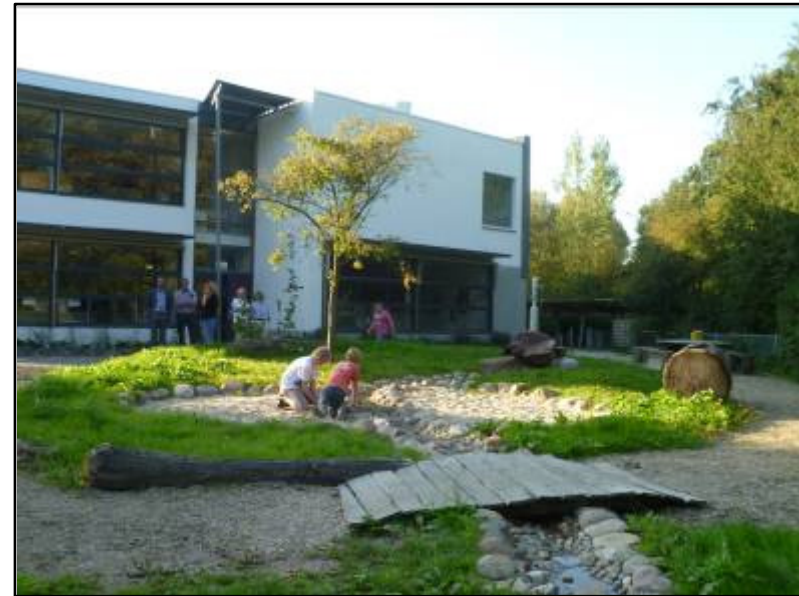
Voorbeeldproject: Pl de Brug (speciaal onderwijs) budget €100.000