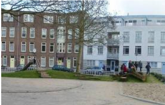
Schoolplein Nicolaas Rotterdam