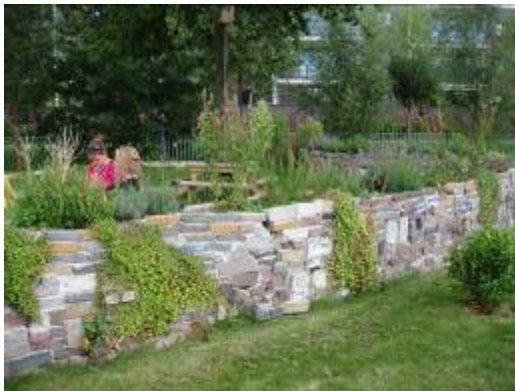
gemaakt door kinderen en ecologisch hovenier