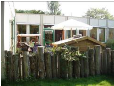
pallissaden kastanje hout