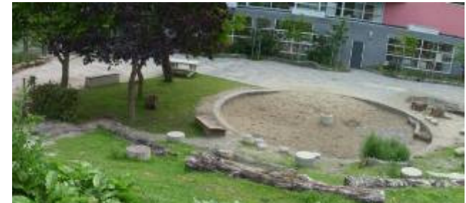
OBS woutertje pieterse, Leiden

combinatie toestellen met natuurlijk spelen