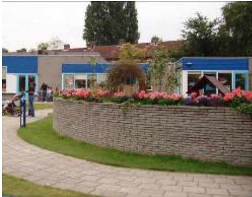
gemaakt door aannemer