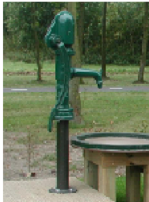
Ijreka uit Dalfsen, www.ijreka.nl € 1.600 grond- of drinkwater