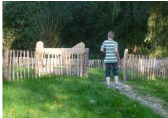
kastanje/eiken rolhekwerk, goedkoop, ziet er goed uit, wel beweegbaar