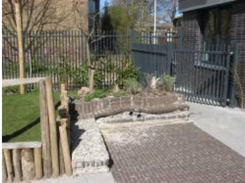
geef speel functie aan omheining