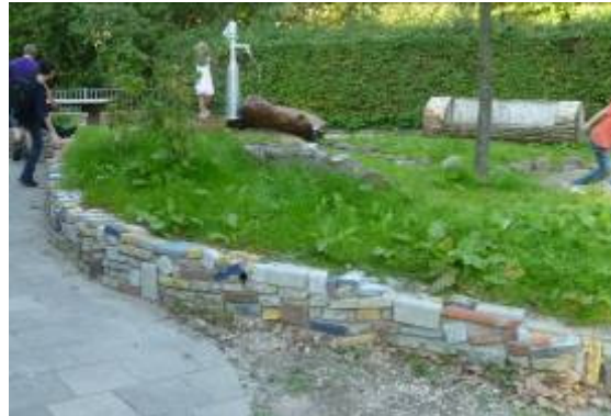
gemaakt door Hoek hoveniers