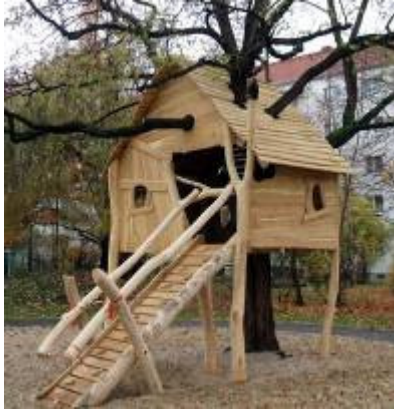
goede speeltoestellen www.speelprojecten.nl