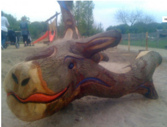
Boomkunst, Hengelo www.boomkunst.nl