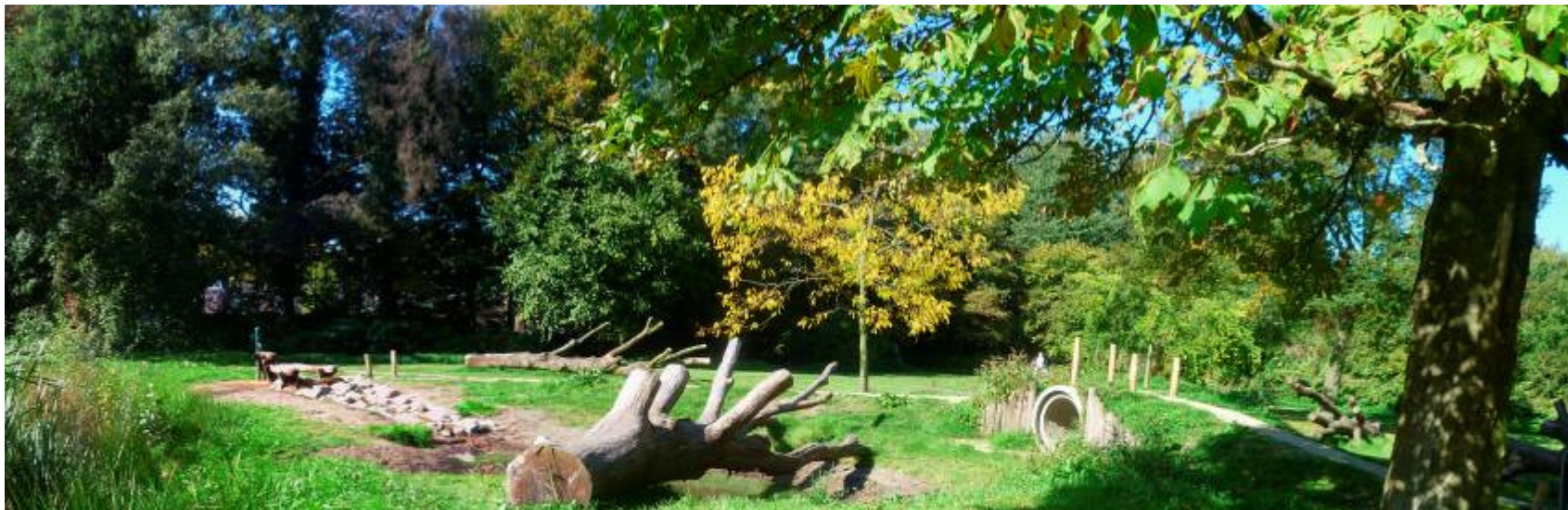
Voorbeeldproject: Gemeente Oisterwijk (€ 15.000)