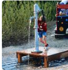
Spereco uit Weert, www.spereco.nl € 4.000 met vlonder grond- of drinkwater