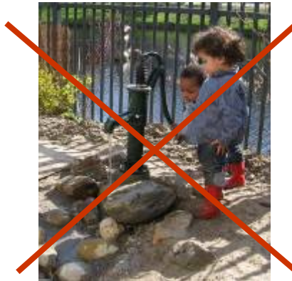
boerderijpomp € 200 www.bhobv.nl diverse leveranciers