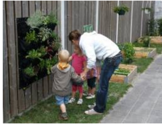
eetbare wand, vierkante meter bakken