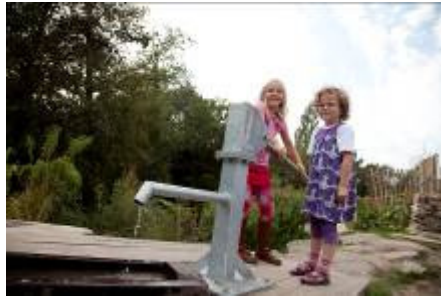
VRM uit Apeldoorn www.swn80.nl €1500 grondwater