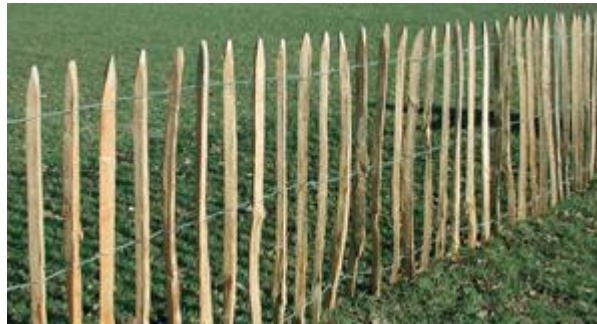
kastanje/eiken rolhekwerk, goedkoop, ziet er goed uit