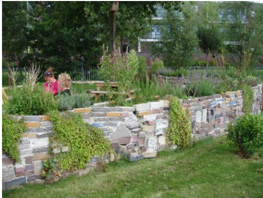
gemaakt door kinderen en ecologisch hovenier