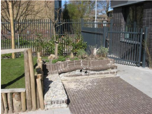
geef speelfunctie aan omheining