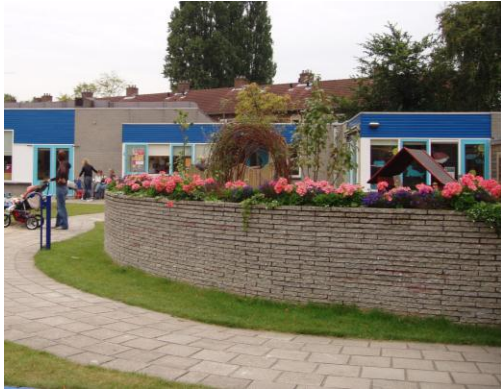
gemaakt door aannemer