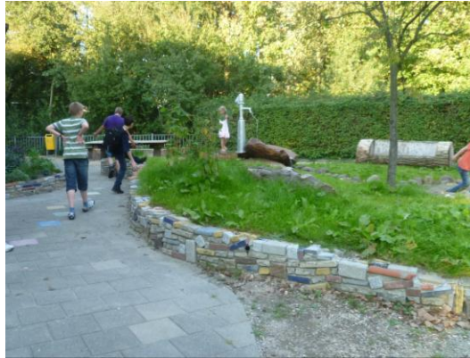
gemaakt door Hoek hoveniers