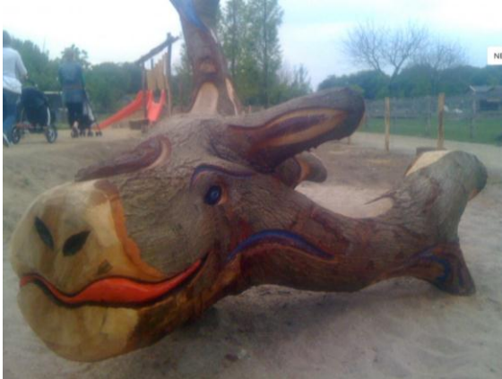
Boomkunst, Hengelo www.boomkunst.nl