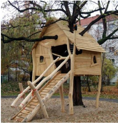
goede speeltoestellen www.speelprojecten.nl