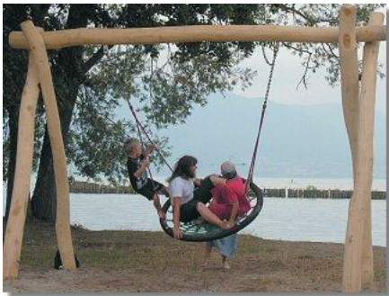
Acacia Robinia nl www.acacia-robinia.nl